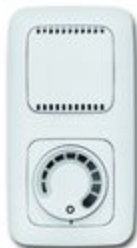
Unterputz UP 5